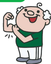
図：全身衰弱と筋肉の萎縮・筋力低下の関係

100%退院を目的としていますので、入院期間を計画し体力回復に向け医師、看護師、薬剤師、リハビリ、栄養、社会福祉士など多職種で全力サポートします。